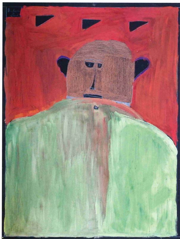
Paul DUHEM , Sans titre, 1999, crayon de couleur et peinture à l'huile sur papier, 65 x 50 cm, Collection Fondation Paul Duhem.

Afin de mettre sur pied une collection cohérente qui a du