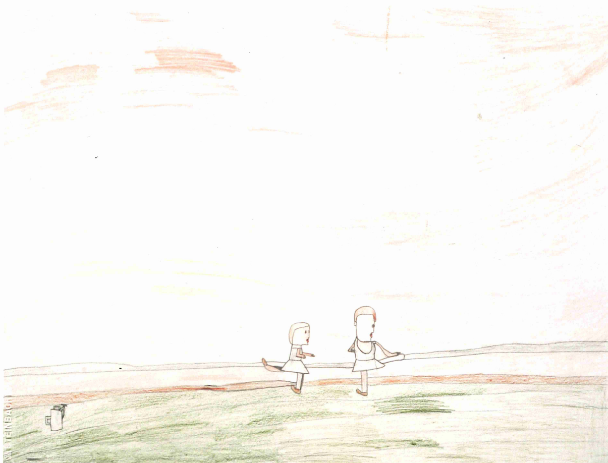
Alexis Lippstreu, Sans titre (tiré des Danseuses s'exerçant à la barre d'Edgar Degas), 2008, crayons gris sur papier, 55 x 73 cm