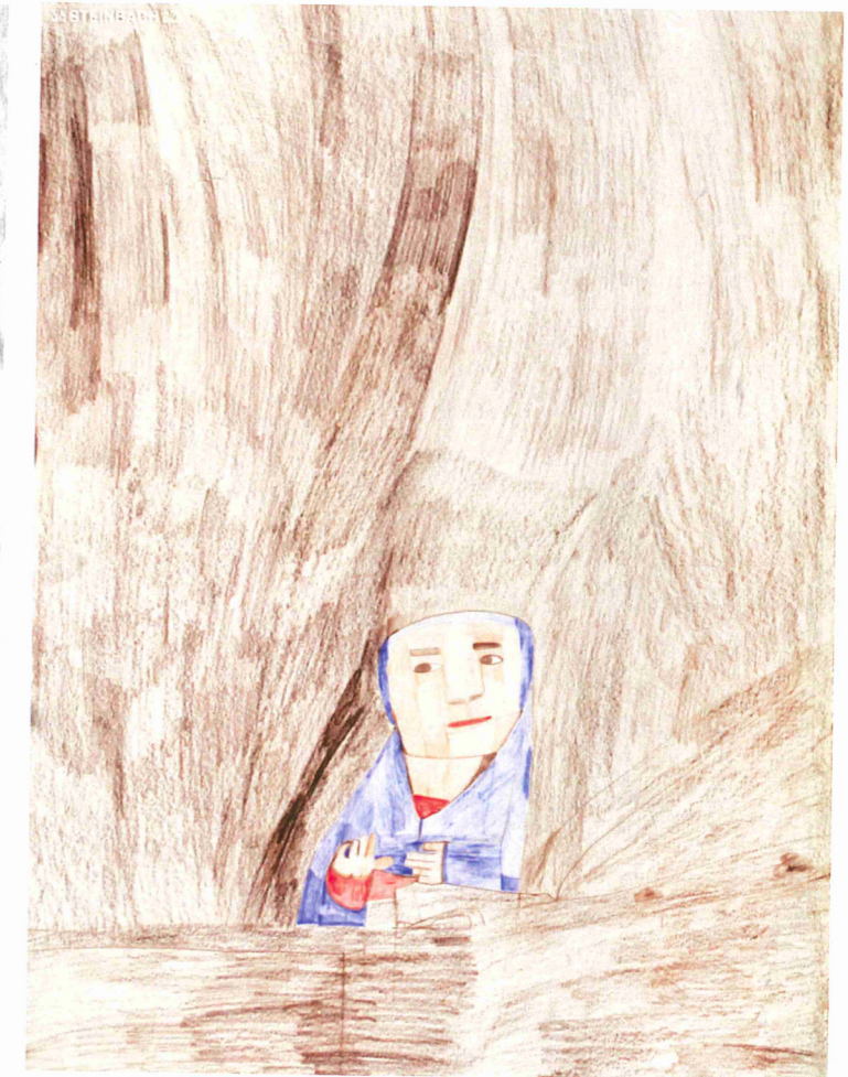
Alexis Lippstreu, Sans titre (tiré de La Vierge de l'Annonciation d'Antonello de Messine), nd, crayons de couleur papier, 73 x 55 cm